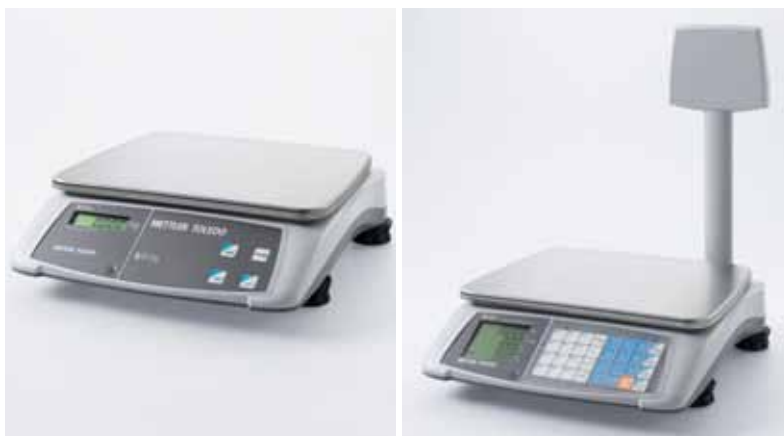
bRite len váženie